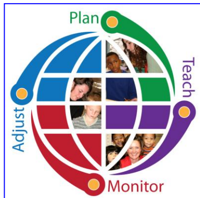
የትምህርትና የጣልቃ ገብ ድጋፍ/የችግር ፈቺ ሂደት ውጤት ከቼሪ ክሪክ ትምህርት ቤቶች የመማር-ማስተማር ሂደት ጋር ይስማማል