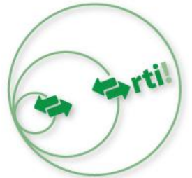
የትምህርት ቤትዎ ተወካይ